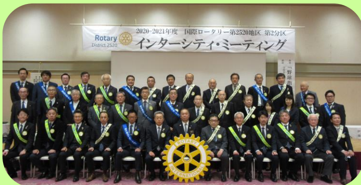
花巻 3 RC 合同記念写真